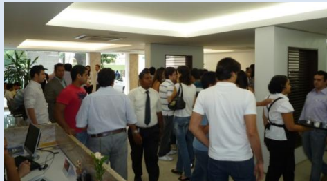
Coffee-break no saguão da Associação Baiana de Medicina em Ondina