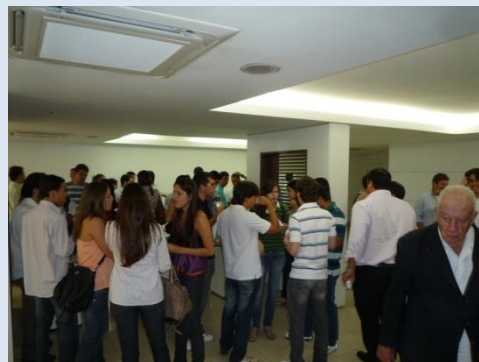
Coffee-break no saguão da ABM com estudantes, residentes, médicos e cirurgiões