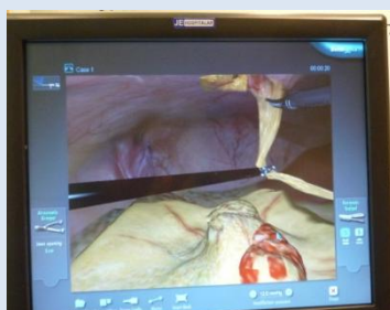
Herniorrafia ventral laparoscópica no simulador sendo realizada no Curso prático